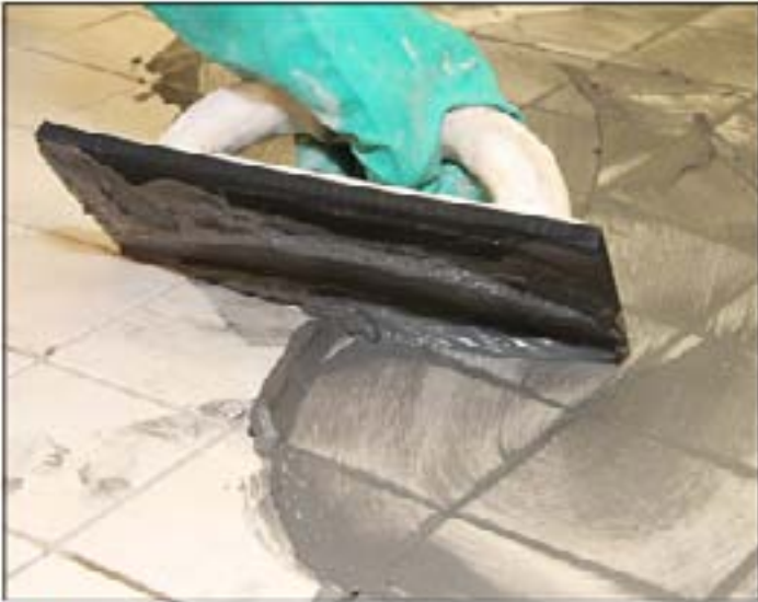
7 Škárovanie dlaždíc z jemnej kaméniny pomocou Sopro DF 10®.