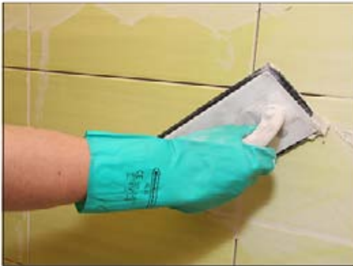
9 Škárovanie pórovinových dlaždíc pomocou Sopro DF 10®.