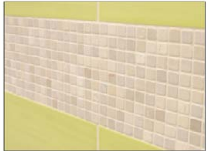
10 Plochy dlaždíc a mozaiky z prírodného kameňa vyškárované pomocou Sopro DF 10®.