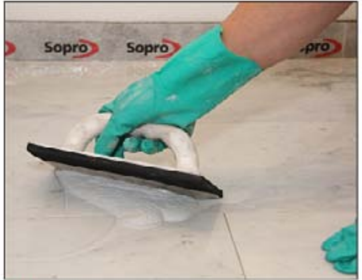
8 Škárovanie dlaždíc z prírodného kameňa citlivého na zafarbenie pomocou Sopro DF 10®.