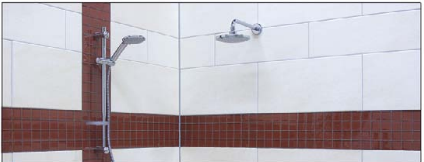
11 Žiariaca farba vyškárovanej plochy v kúpeľni.